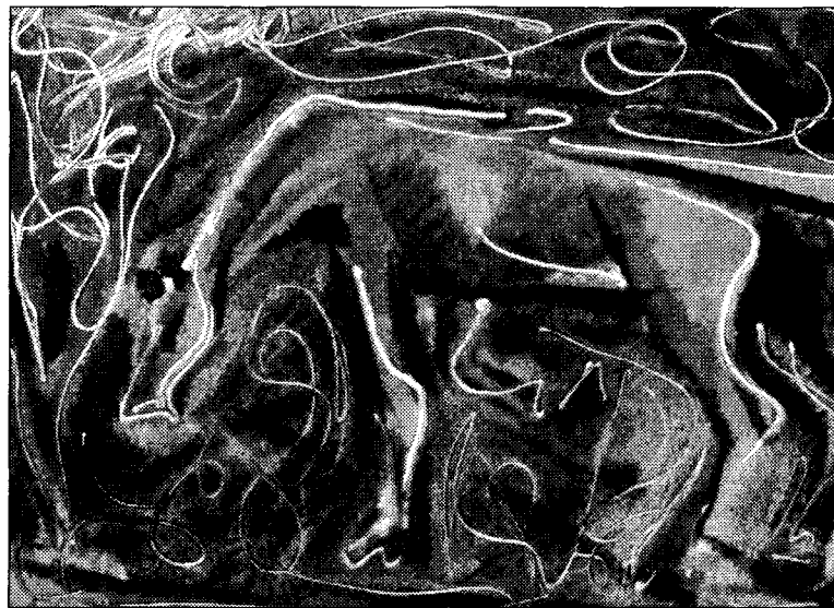
Коню мій білий. Акварель